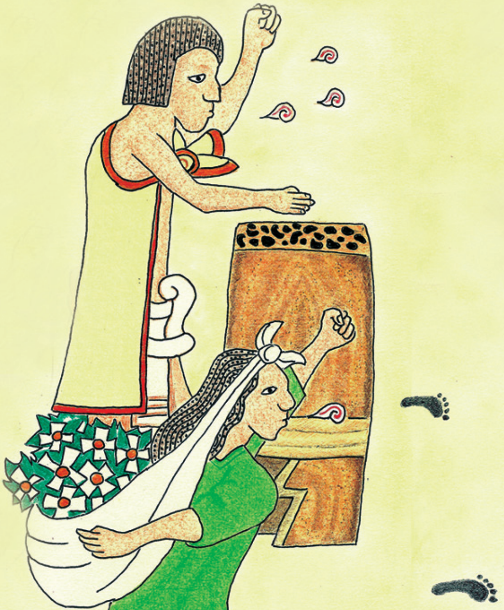
Imagen de portada